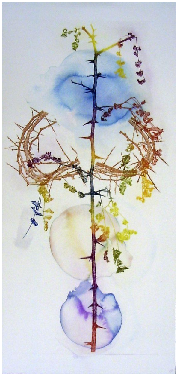
Verrijzenis (2006), Ets en aquarel, Paul van Dongen (1958) Tekst: Marloes Meijer