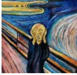
'De Schreeuw' Evard Munch

Een mens lijdt dikwijls 't meest Door 't lijden dat hij vreest Doch dat nooit op komt dagen. Zo heeft hij meer te dragen Dan God te dragen geeft.