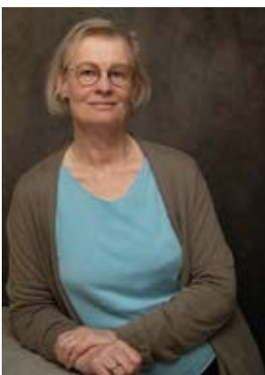
Marieke School pag. 17