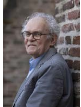
Christ School pag. 16