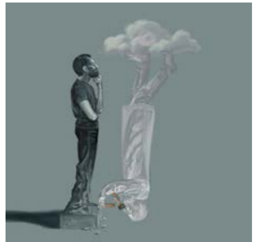
Illustratie Vincent Huijbers

„Gewiss, das Individuum ist nichts ohne das Ganze zu dem es gehört. Aber es gilt auch das Umgekehrte: dieses Ganze gebe es gar nicht wenn es sie nicht in unsere Köpfe, in jedermanns Kopf, spiegelt. Die Welt wird bedeutungsreich oder öde sein, je nach dem ob das Individuum hell oder stumpf ist. Kosmische Civilization zu gestalten bleibt deshalb eine Aufgabe, die sich nur bewältigen lässt wenn darüber nicht die andere große Aufgabe versäumt wird: das Individuum, sich selbst, zu gestalten. “