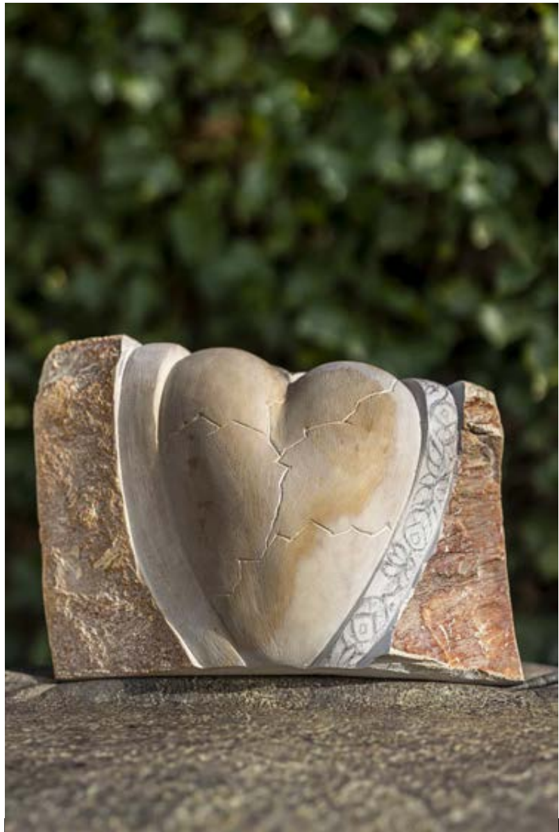
Beeld in wording

De handen die ik oorspronkelijk om het hart heen wilde vouwen, waren lastig uitvoerbaar. Andere ideeën haalden het niet. Tot mijn oog weer eens op de grafzuiltjes van mijn opa en oma viel, jaren geleden door mij opgehaald in Zeeuws-Vlaanderen toen hun graf werd geruimd. (De grootste zuil met slechts één alleszeggend woord erop, PAX, kon ik helaas niet meenemen.) Ik heb opa en oma nooit gekend. Twee liefdevolle, integere mensen, vrij jong gestorven, vlak na elkaar, waarna het grote gezin zonder ouders verder moest. Een kundig beeldhouwer heeft destijds een door mij altijd bewonderd bloemmotief in de zuiltjes gehakt. Opeens wist ik, dát wil ik rond het hart: een bloemenguirlande met dát motief. Een gehavend hart, omringd, getroost en verbonden dwars door generaties heen. Bloemen, door de eeuwen heen symbool voor liefde, rouw, hoop. Als teken van medeleven, als hart onder de riem.