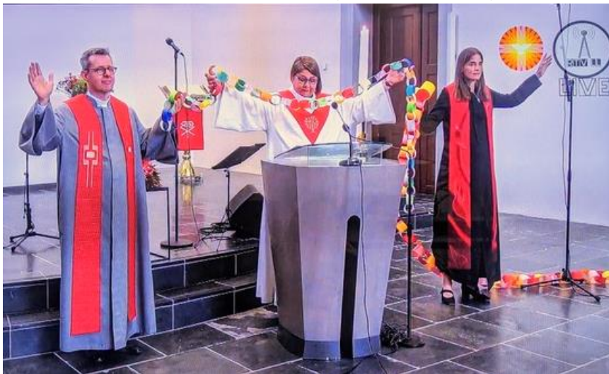
Foto: Pinksterdienst 'Link'

Hemelvaart was bijzonder, met 3 zingende dominees. Pinksteren was kort maar kracht: jazzmuziek, slingers en vooral veel verbondenheid... de uitzendingen van de vieringen samen met de verschillende kerkelijke gemeenten in en om 's-Hertogenbosch worden goed bekeken. Er is een prettige